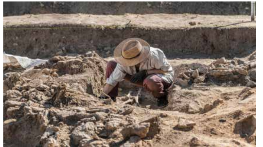
التفاصيل على موقع تشرين

ويجزم الدكتور سعد أن سورية غنية بالآثار وهي مهد الحضارات ولعل الرموز التصويرية التي تم الكشف عنها في موقع تل المرأ قديم حتى أقدم من المصرية، لكن الاكتشاف قديم وكل ما يتم تداوله عبارة عن فرضية لم يتم البت بها من قبل أصحاب الاختصاص.