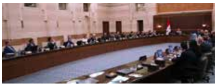
تفاصيل على موقع تشرين