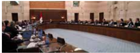
تفاصيل على موقع تشرين