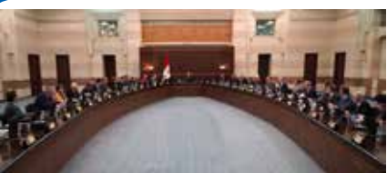
تفاصيل على موقع تشرين

بعد منتهي يوم من العدوان الإسرائيلي المتواصل على قطاع غزة منذ السابع من تشرين الأول الماضي، لا يملك كيان الاحتلال الصهيوني والداعمون له - من الولايات المتحدة الأمريكية إلى القوى الغربية - سوى الاستمرار في استراتيجية الهروب إلى الأمام، ولاسيما بعد الإخفاق التام في تحقيق أي إنجازات في