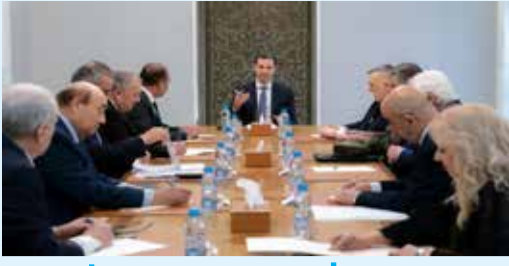
تفاصيل على موقع تشرين

الرئيس الأسد يناقش مع أعضاء القيادة المركزية لحزب البعث جدول أعمال الاجتماع الموسع المقرر انعقاده قريباً