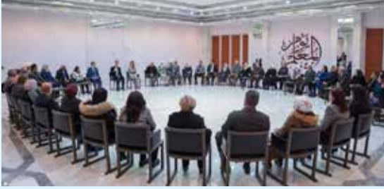
تفاصيل على موقع تشرين