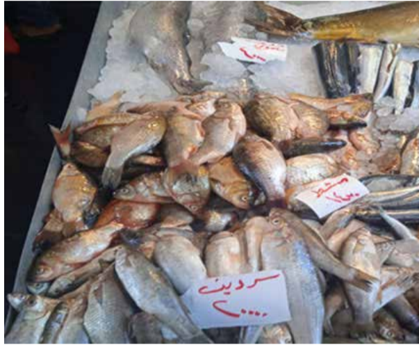
من الصيد البحري وهو المستوى الذي كان عليه قبل الأزمة.

وأكد أنه بعودة قسم كبير من المناطق للعمل بعد تحريرها وقيام الهيئة بأعمال الحماية وعمليات الاستزراع وتوفير الأصبغيات للمربين خلال السنوات الأخيرة ارتفع إجمالي الإنتاج لـ ١٢٥٥٩/٢٥٢٢ طناً في ٢٠٢٢ منها ٢٥٢٢ طناً بواسطة الصيد من المسطحات العذبة و ٧٧٦٠ طناً من المزارع السمكية و ٢٢٧٧ طناً