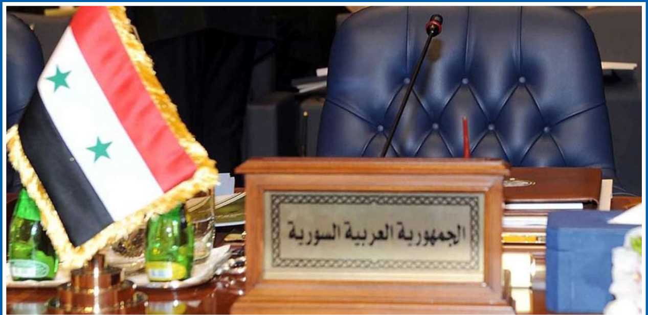
تفاصيل على موقع «تشرين»

6 الأمراض الموسمية تتصدر المشهد في المدارس..