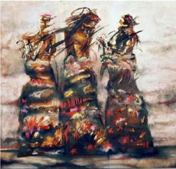
تشرين- لبنى شاكر