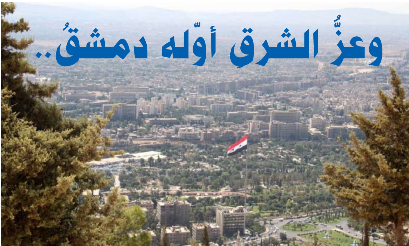
■ تصوير: تشرين - طارق الحسنية